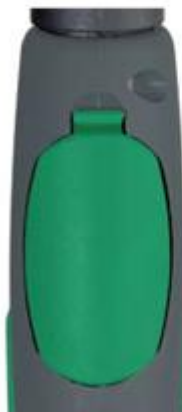
80300102 Dekseltje. Voor gebruik bv. met voetschakelaar