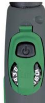
80300130 Drukknop met horizontale TIG-duimwielregeling oud type 80300070 Nieuw type