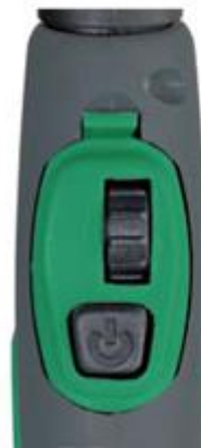
80300101 Drukknop met verticale TIG- duimwielregeling oud type 80300061 Nieuw type