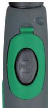
80300100 Drukknop oud type 80300060 Drukknop nieuw type