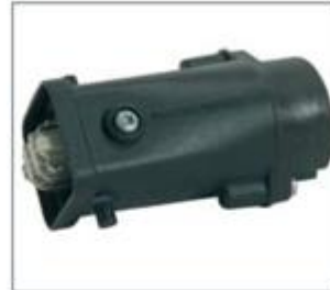
80300116 7/6 polig-adapter

Een Migatronc TIG-lastoorts is voorzien van een eenvoudig vervangbaar besturingsprintje op het toortshandvat. Standaard bestaat de besturing uit een aan-uit drukknop, maar voor gebruik op Migatronc TIG-apparaten adviseren we gebruik te maken van een besturing met zowel een aan-uit drukknop als een duimwielregeling.