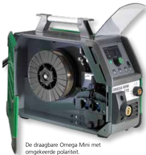
De draagbare Omega Mini met omgekeerde polariteit.