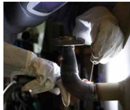
De Focus TIG 200 DC HP PFC last koolstofstaal, roestvast staal en andere DC-lasbare materialen